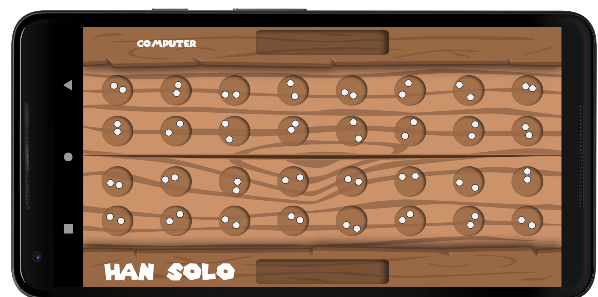
Spielbrett der Bao-App